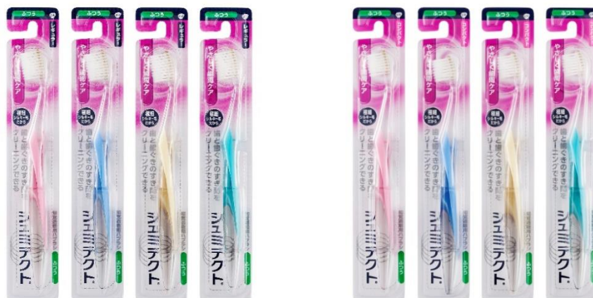
【新製品】シュミテクト® やさしく歯周ケアハブラシ ふつう

また、従来の「シュミテクト®トラベルセット」は、内容を一新し、「シュミテクト®歯周ケアトラベルセット」として、同日、新発売いたします。「シュミテクト®歯周ケアトラベルセット」は、「薬用シュミテクト®歯周病ケア(22g)」と「シュミテクト®やさしく歯周ケアハブラシ コンパクト(ふつう)」のセットです。