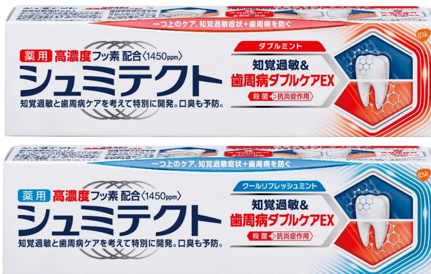
シュミテクト 歯周病ダブルケア EX

「シュミテクト 歯周病ダブルケア EX」は、シュミテクトで初めて殺菌成分を最大濃度(*3)配合しました。知覚過敏症状だけでなく歯周病も同時に徹底ケアすることが可能になります。フレーバーは、さわやかマイルドな「ダブルミント」と息スッキリ爽やかな「クールリフレッシュミント」の2種類です。