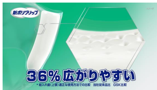
36%広がりやすいから