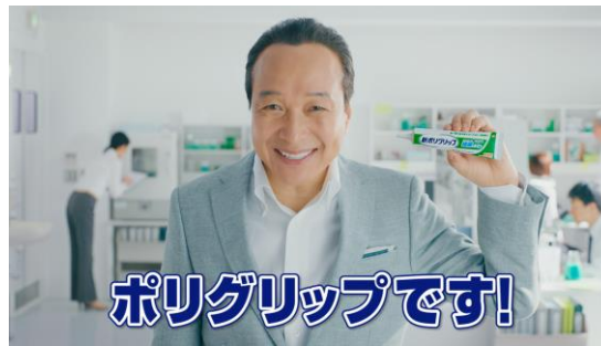
という方には、ポリグリップです！