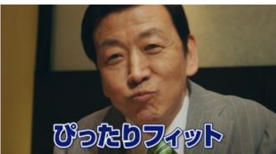
ぴったりフィットしますよ。