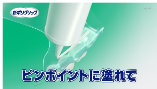
極細ノズルでピンポイントに塗れて