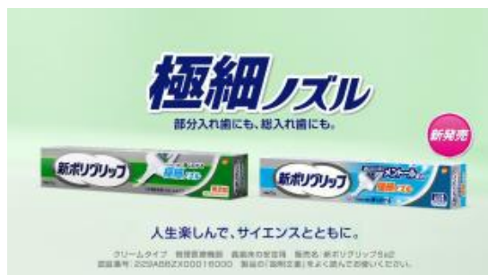
極細ノズルから、「メントール配合」新発売。