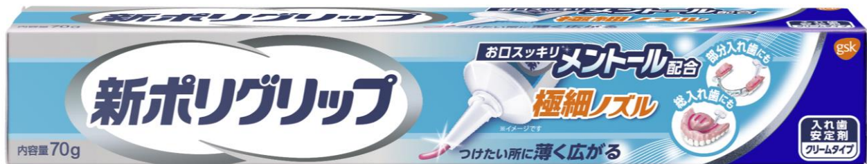
新ポリグリップ 極細ノズル メントール配合

お客様からは、「お口がすっきりしそう」、「爽快なメントールがプラスされているならすぐにでも使いたい」といった声が寄せられています ※3 。